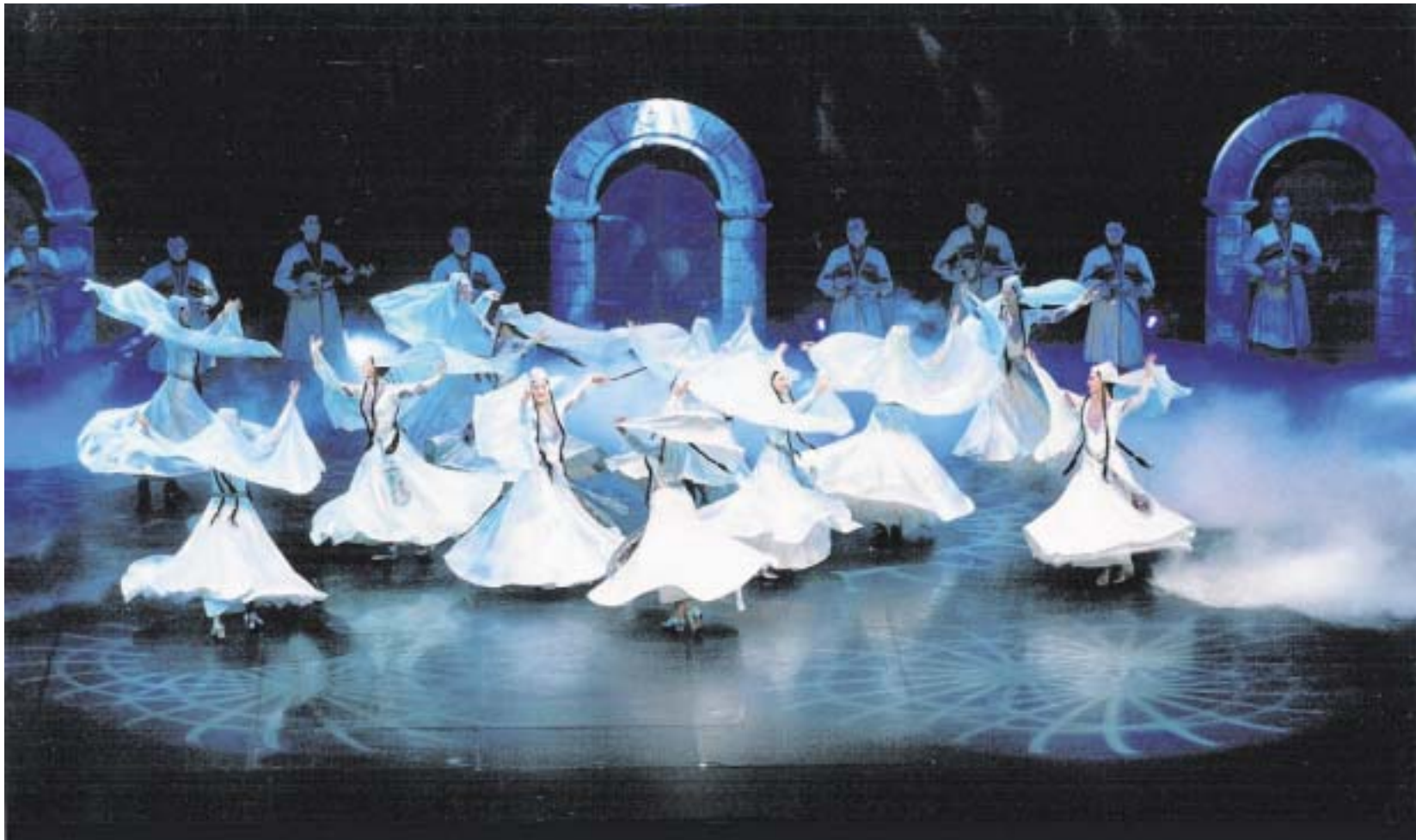
Tänzerinnen schweben in graziler Vollendung. Der georgische Tanz verbindet das Vermächtnis der Vergangenheit mit der Moderne.

Mit „Legends of the Storm“ erzählt das Ensemble Erisioni in anmutigen und rasant-wilden Bildern von der bewegten Geschichte Georgiens. Musik und Tanzshow will im deutschsprachigen Raum Fuß fassen