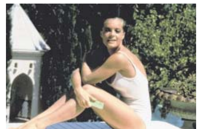
Eine Ikone des europäischen Kinos: Romy Schneider im Krimidrama „Der Swimmingpool“.

„Der Swimmingpool“ avancierte 1970 zum Sommerhit der Kinosaison und legte den Grundstein für die Weltkarriere der früheren Sissi-Darstellerin: „Romy beweist hier sowohl Intelligenz und Talent als auch Schönheit“, jubelte die französische Filmkritik. In der Folge drehte Romy Schneider selten weniger als zwei Filme pro Jahr – ihr privates Glück fand sie jedoch nie. Vor 25 Jahren, am 29. Mai 1982, wurde die Schauspielerin tot in ihrer Wohnung aufgefunden. Ihre Beerdigung organisierte Alain Delon.